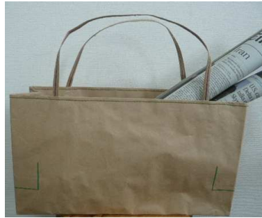
米袋バッグ ちっちゃい『お袋さん』 緑ステッチ バゲットバッグ

「米袋バッグを自分でも作ってみたい!!」というお声を頂いて何方でも作れるようにパンフレットにしました。ミシンでの作り方は勿論、のりとホッチキスで簡単に作れる方法と小さいサイズの作り方をイラストでわかりやすく説明しています。