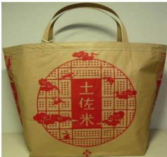
米袋バッグ『お袋さん』 赤土佐

リサイクルの米袋で作った 米袋バッグ『お袋さん』。家庭用ミシンでジーンズのステッチ糸、持ち手には市販のクラフトバンドを使用しています。