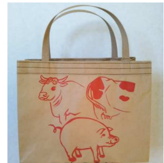
ロス袋バッグ『お袋さん』 1匹と2頭 (内ポケット付)

柿渋を、塗っては乾かし〜塗っては乾かし〜を3回繰り返しています。(バッグ内側は柿渋塗りなし、持ち手内側は1回塗り) 柿渋は防水や防腐の効果もあり、温度や紫外線が当たることによって色に深みが出てきます。