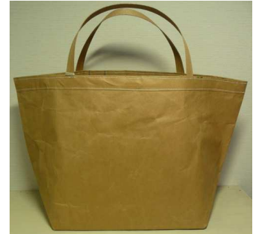
米袋バッグ『お袋さん』 ノーマル

家庭用ミシンでジーンズのステッチ糸で、持ち手も米袋の紐を使用しています。食パン3斤分がすっぽり入る大きさです。こちらの米袋は未使用の新しいものを使っておりますのでパンなどの食品を入れて頂けます。