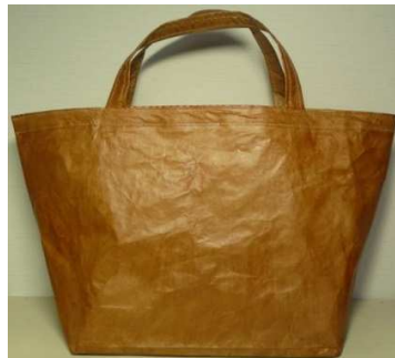
米袋バッグ『お袋さん』 柿渋

家庭用ミシンでジーンズのステッチ糸で縫っています。持ち手には市販のクラフトバンドを使用しています。高知の『米家』さんオリジナル米袋、赤の「土佐米」のモダンなデザインになります。